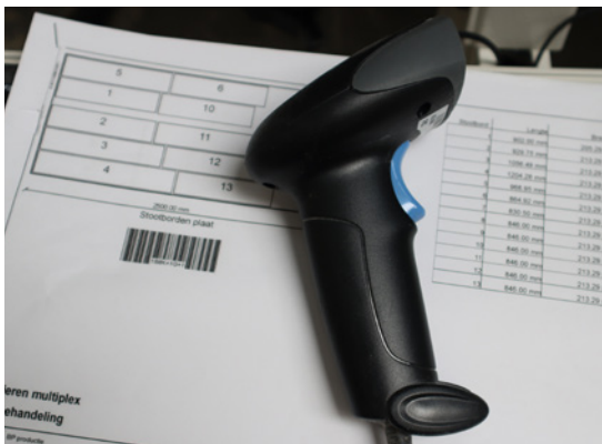
Alle Maschinen haben Barcodescanner.