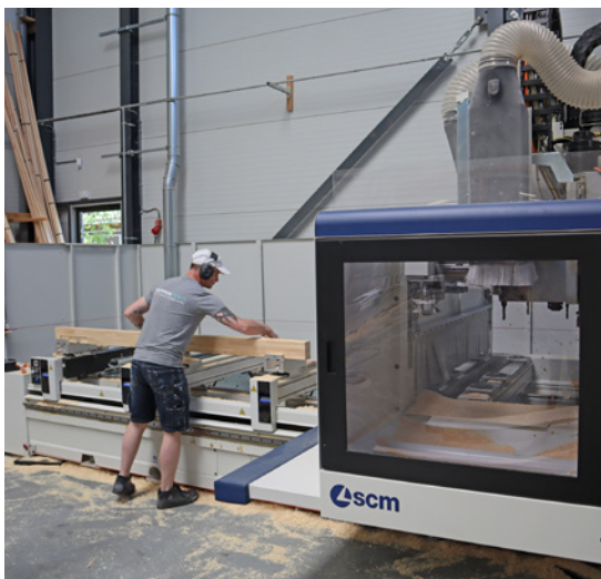
Die 3 brandneuen CNC-Maschinen werden mit Compass Software angesteuert..

Die erste Maschine bei Trappentoko ist eine 2018 SCM Accord 25 fx. Die 3-Achs Maschine wird für die Produktion von Stufen eingesetzt. Die CNC hat zwei Tische; es kann also im Wechselbetrieb gearbeitet werden, d.h. während die Maschine auf einer Seite Stufen bearbeitet, kann ein Maschinenbediener die fertigen Stufen auf der anderen