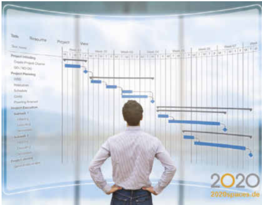
Die Software von 2020 managt Projekte und automatisiert Prozesse

Software von 2020 Technologies für Objektausstatter und Ladenbauer